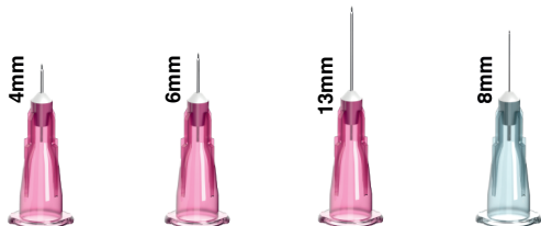
MD-32G-4 MD-32G-6 MD-32G-13 MD-34G-8