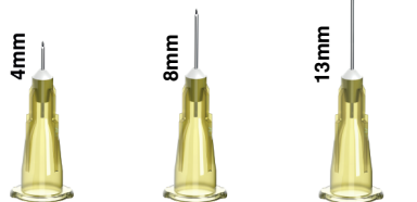
MD-30G-4 MD-30G-8 MD-30G-13